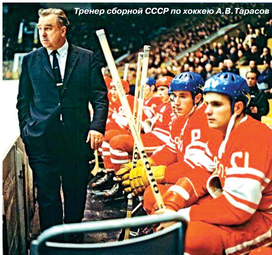
Тренер сборной СССР по хоккею А.В. Тарасов

Мы уже не помним, что все эти изобретения и прорывы были совершены всего за какие-то десять лет. С тех пор скорости развития только увеличиваются. Полёт в космос, ядерный синтез, микробиология и многое другое. И вот мы добрались до 21-го века. Скорости и плотность изменений столь велики, что предкается новый скачок, который в очередной раз изменит всё. К таким изменениям относятся уход от проводов, переход на альтернативные источники энергии, с полным замещением углеводородной энергетики на солнечную, ветряную и